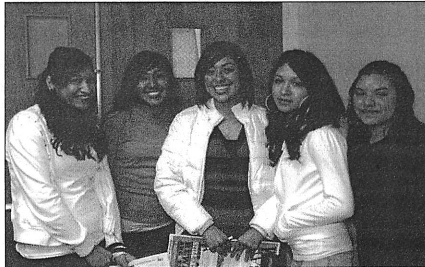
El año pasado cerca de 700 estudiantes de preparatoria junto con sus padres asistieron al Congreso Educativo para Latinos realizado en Hayward. Este año el congreso tiene como tema principal "La educación es asunto de todos".

A fin de ayudar a revertir esta tendencia, por diez años consecutivos, el Departamento de Educación del Condado de Alameda, la Cámara de Comercio Hispana del Condado de Alameda, la Universidad Estatal de California-Campus East Bay, entre otras agrupaciones; han orga-